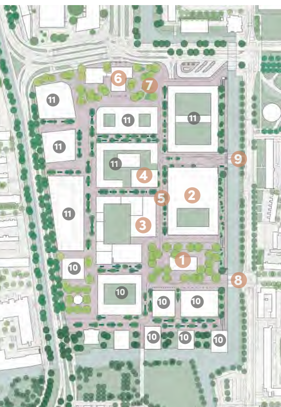
Beeld: JCAU en Buro Lubbers

Wonen, ontmoeten en genieten in Centrum Schalkwijk Het gebied rond het winkelcentrum verandert de komende jaren in een levendig en groen stadsdeelhart. Je kunt er comfortabel wonen met alles wat het leven aangenaam maakt binnen handbereik. Niet alleen winkels en handige voorzieningen, maar ook sportfaciliteiten, restaurants, cafétjes en natuurlijk de bioscoop.